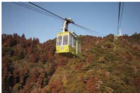
1号ゴンドラ「ひこぼし」